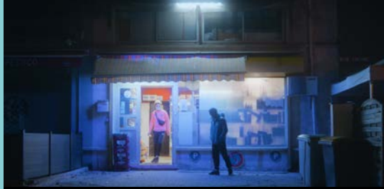
GRAND PARIS de Martin Jauvat