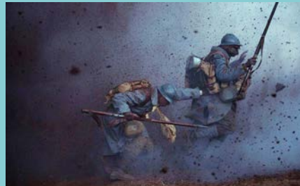
TIRAILLEURS de Mathieu Vadepied