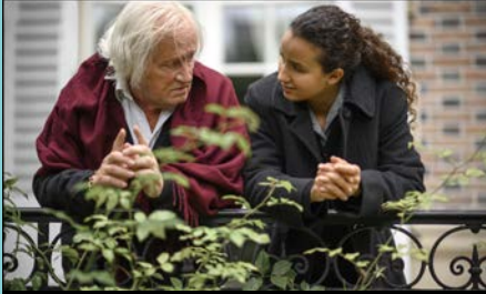
DIVERTIMENTO de M. C. Mention-Schaar