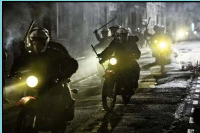
NOS FRANGINS de Rachid Bouchareb