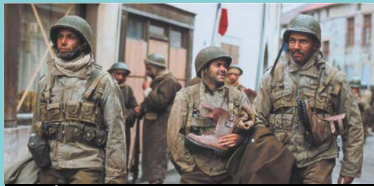
INDIGÈNES de Rachid Bouchareb