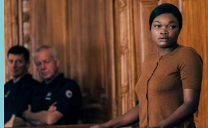
SAINT OMER d'Alice Diop