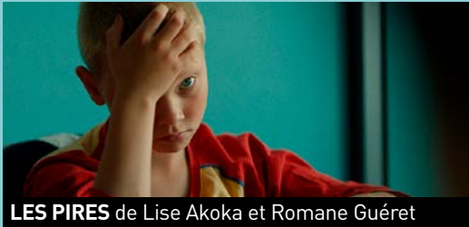
LES PIRES de Lise Akoka et Romane Guéret