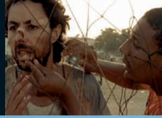
D'AMOUR ET D'EAU FRAÎCHE