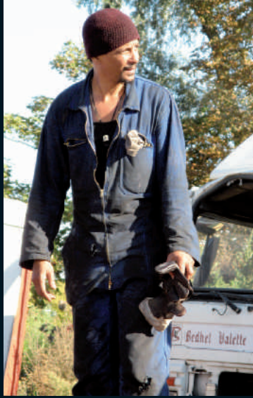
LES AMANTS DU PONT-NEUF